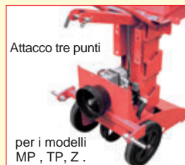
Attacco tre punti per i modelli MP, TP, Z.

OPTIONAL: Timone per spostamenti a mano cod. 1141108