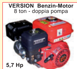
VERSION Benzin-Motor 8 ton - doppia pompa 5,7 Hp