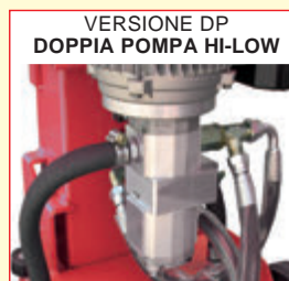
VERSIONE DP DOPPIA POMPA HI-LOW