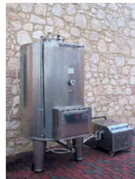
Note: (1), (2), (3) a pag. 26 del catalogo generale. Notes (1), (2), (3) on page no. 26 of the general catalogue.